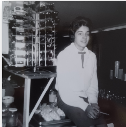
Mon premier emploi au Moulin Rouge.

J'ai commencé à travailler à l'âge de 15 ans au « Moulin Rouge », un restaurant près de chez moi sur l'autoroute 20. C'était une clientèle de passage et parfois des autobus. J'ai commencé de nuit, c'était la coutume. Puis un jour, une nouvelle employée arrive. Madame commence de nuit comme les autres. Mais voilà qu'un matin, j'arrive au travail et Madame pleure dans le salon. Madame veut travailler de jour. Madame ne peut pas dormir le jour. Qui doit la