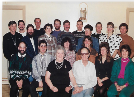
50e anniversaire de mes parents.

Papa, tu as connu les hôpitaux et pour ton dernier séjour, tu es entré à l'hôpital Sainte-Croix de Drummondville le 10 février 2002. Tu y es resté jusqu'à ton décès le 20 février 2002 vers 3 heures du matin. Au revoir Papa.