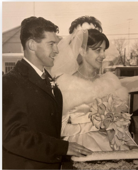
Photo de mariage