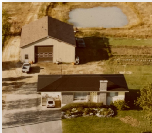
Maison et garage familial

Nous voilà chez nous. Une belle maison neuve que Guy avait fait construire spécialement pour nous et notre petite famille. Comme vous pouvez le constater sur la photo, un magnifique bungalow comprenant 3 chambres à coucher, grand salon adjacent à la salle à manger, les deux très bien éclairés par de grandes vitrines. Une salle de bain et une cuisine complètent le rez-de-chaussée. Le