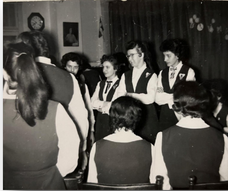
À l'École normale

Par la suite, pour devenir professeure, je devais aller à l'École Normale. La chance était de mon côté, cette école se