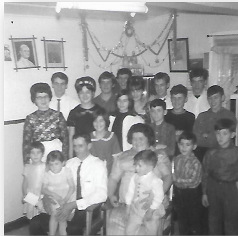
25e anniversaire de mariage de mes parents et dernière photo de famille avant mon mariage.

Bien des choses ont changé depuis. D'abord la mode: mes cheveux étaient crêpés et peignés en forme de cloche. Mes robes ajustées à la taille et à grandes jupes plissées qui ne me conviendraient plus aujourd'hui. Aussi, les shorts commençaient à faire leur apparition. Ma mère ne voulait pas prendre la responsabilité d'accepter que j'en porte, tout comme la ciga-