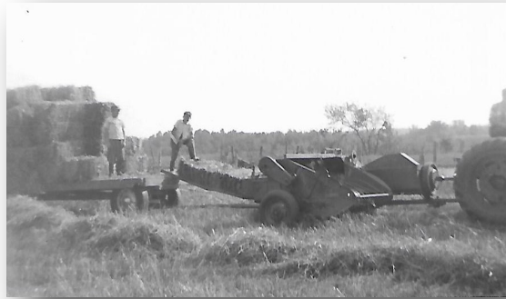
Les foins et la balleuse

L'été, c'est aussi la saison des foins. Il faut le couper et le mettre en ondins avec le grand râteau. J'ai vu mon père le ram-