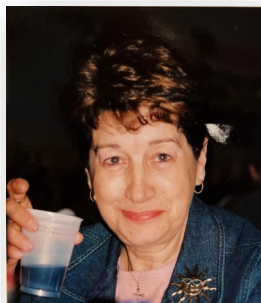
Mes 60 ans

peute, même si j'étais déjà sensibilisée à des approches similaires. Je me renseigne en quoi ça consiste et surtout comment et si je peux vivre financièrement avec ce métier. Je m'inscris donc et de fil en aiguille, le corps humain étant très complexe, plus j'en apprenais, plus je me rendais compte que je m'y connaissais très peu et plus j'avais besoin d'en savoir plus.