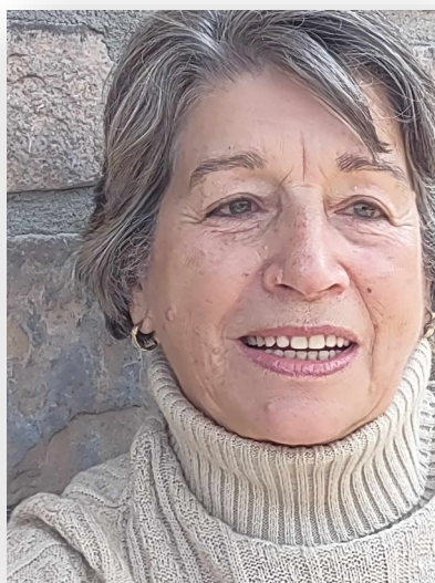
Mes 80 ans

Voici quatre-vingts ans de souvenirs. Oui 80 ans bien « sonnés ». Mes trois adorables fils que j'aime plus que tout, me l'ont souligné fort agréablement bien lors de ma fête l'été dernier. En plus de leurs petites familles, ils avaient convié tous mes frères et sœurs ainsi que leurs conjoints, conjointes à un « méchoui » dans la cour extérieure chez Steven. Plusieurs amies furent aussi invitées mais l'été, plusieurs d'entre elles, un peu contrariées, ont dû refuser pour cause de vacances planifiées à l'extérieur.