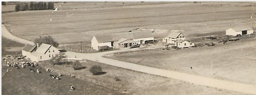
Ferme à la Chaussée.

À ma naissance, nous demeurions voisins de mon grand-père paternel, Onésime Houle. Mon père avait acheté une petite