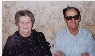
Papa et maman

Bergeron, ce nom vient du mot Berger. Ce nom a été déformé selon le parler régional et les habitudes, en Berget, Bergerac, Bergère, Berger.