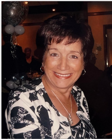
Mes 72 ans

Devenue célibataire et autonome financièrement, je me permettais d'assister à différents spectacles de musique et d'humour, des conférences concernant mon travail ou en développement personnel, d'aller à des soupers et soirées dansantes, de participer à des groupes de célibataires et même m'impliquer dans des comités, de faire des petits voyages en autocar au cours desquels j'ai eu l'occasion de visiter mon beau Québec, soit à Montréal, Québec, Sherbrooke, Outaouais ou ailleurs. Et même de plus longs voyages et croisières en groupes organisés à travers le monde.